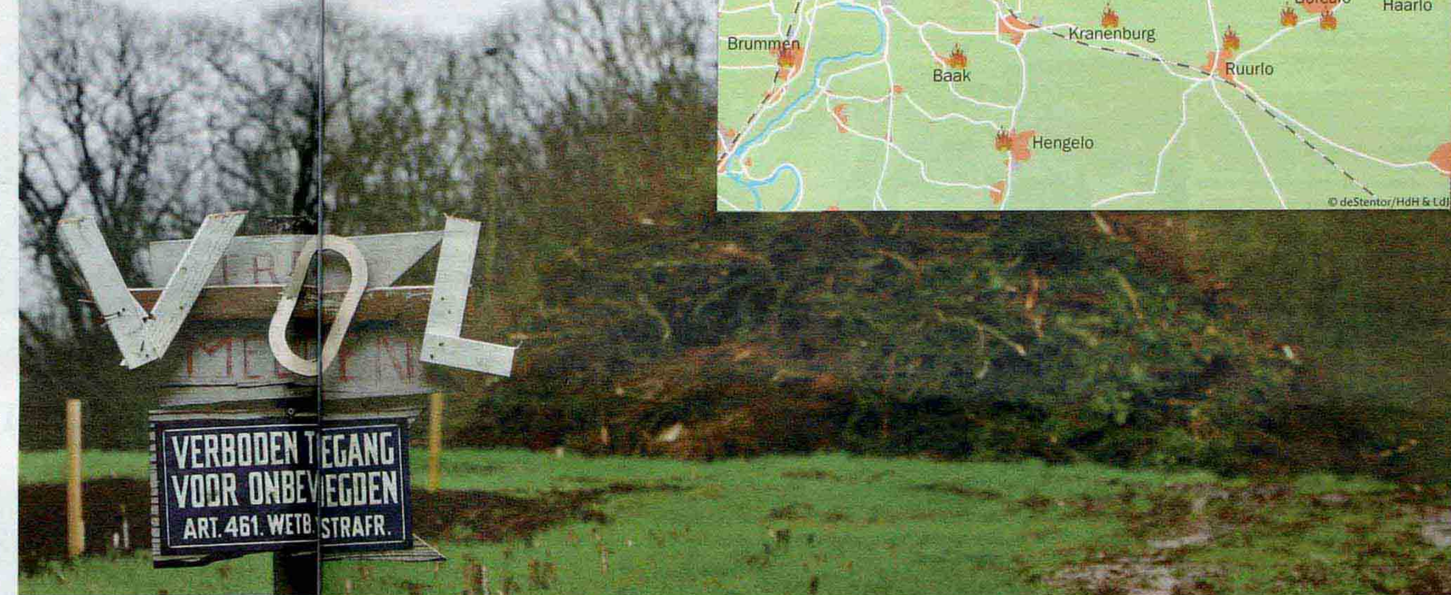
De paasboake bij de Fam Lueks in

Achter Boerderij Vels aan de Zelheweg 2 wordt zondag het